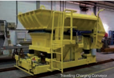
Travelling Charging Conveyor