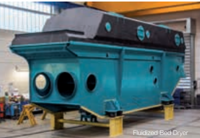
Fluidized Bed Dryer